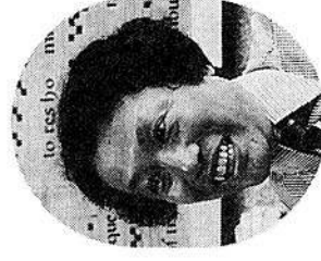
作曲者 湯山 昭

「四国は第二の故郷」と、五年前に招かれた時のカトリックの方々と深い友情から思い続けて来た私。その経緯から、このたび、「聖母幼稚園園歌」を書く機会を与えられ、作詩者としてこれ以上の喜びはない。 どんな遠いところへも、自分の眼と心で確かめるために出掛けて行って作詩するということ信条から、再び四国入りをし、すがすがしい園の前に立ち、健かな子ども達と話した時、詩の第一節が胸の底から湧き上り、梅雨明けの青空と入道雲の下の瀬戸内の帰途の船の中で、それは決定的となった。輝く瞳の、柔かい心に、いつまでも残る歌でありたいと、祈るような気持で書きあげた聖母幼稚園の園歌。湯山先生の名曲を得て、私の小さな歴史の中に、四国の方々と園いきずすと共に、生涯印象深く残るものと、信じたい。