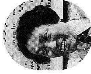
作曲者 湯山 昭

「四国は第二の故郷」と、五年前に招かれた時のカトリックの方々と深い友情から思い続けて来た私。その経緯から、このたび、「聖母幼稚園園歌」を書く機会を与えられ、作詩者としてこれ以上の喜びはない。 どんな遠いところへも、自分の眼と心で確かめるために出掛けて行って作詩するということ信条から、再び四国入りをし、すがすがしい園の前に立ち、健かな子ども達と話した時、詩の第一節が胸の底から湧き上り、梅雨明けの青空と入道雲の下の瀬戸内の帰途の船の中で、それは決定的となった。輝く瞳の、柔かい心に、いつまでも残る歌でありたいと、祈るような気持で書きあげた聖母幼稚園の園歌。湯山先生の名曲を得て、私の小さな歴史の中に、四国の方々と園いきずすと共に、生涯印象深く残るものと、信じたい。