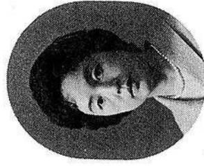
作詞者 中村 千栄子